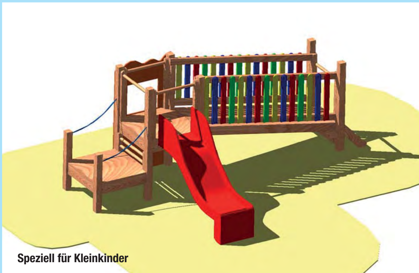
Speziell für Kleinkinder