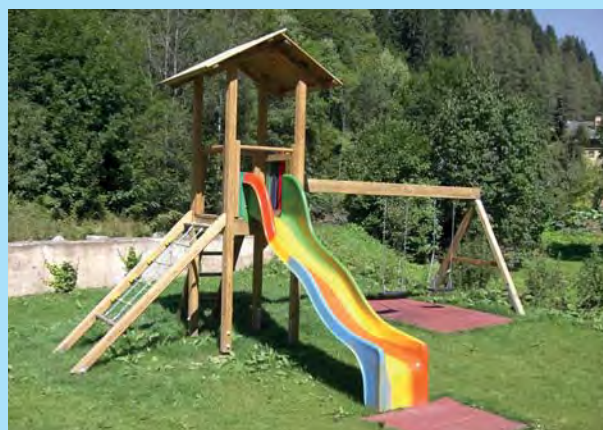
Spatz 074 mit zusätzlicher Reifenschaukel und Giebeddach

Geräteabmessung: 566x448x380cm Fallschutz: Rasen, Fallschutzplatten, Kies, Rindenmulch, Sand, Hackschnitzel Fundamente: 6 Stk. 400/400/400 mm 4 Stk. 600/400/400 mm